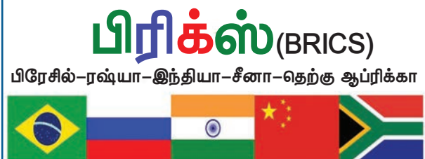
பன்னாட்டு பொருளாதார அமைப்புகள்

வேகமாக வளர்ந்துவரும் நாடுகளின் முதல் எழுத்துக்களைக் கொண்டு குறிப்பிடப்படும் சுருக்கப்பெயர் பிரிக்ஸ் (BRICS) பிரேசில், ரஷ்யா, இந்தியா, சீனா மற்றும் தென் ஆப்பிரிக்கா ஆகியவையே அந்த ஐந்து விரைவாக வளர்ந்து வரும் நாடுகள், இது 2010 வரை தென் ஆப்பிரிக்காவை உள்ளடக்காமல் பிரிக் என அழைக்கப்பட்டது. பிரிக் என்ற சுருக்கப் பெயர் 2001ல் பயன்பாட்டுக்கு வந்தது. பிரிக்ஸ் உறுப்பினர்கள் அவை அமைந்துள்ள புவிப்பகுதிகளில் குறிப்பிடத்தக்க ஆதிக்கம் செலுத்தும் நாடுகளாகும். இந்த நாடுகள் 2009 லிருந்து உச்சி மாநாடுகளை நடத்தி வருகின்றன. பத்தாவது உச்சி மாநாடு தென் ஆப்பிரிக்காவில் ஜூலை 2018ல் நடைபெற்றது. உள்ளடக்கிய வளர்ச்சி, வாணிகப் பிரச்சனைகள், உலகளாவிய அரசு நிர்வாகம், பகிரத்தக்க வளமை, நாடுகளின் அமைதி மற்றும் பாதுகாப்பு ஆகியவையே இந்த உச்சிமாநாட்டின் விவாதத் தலைப்புகள் ஆகும்.