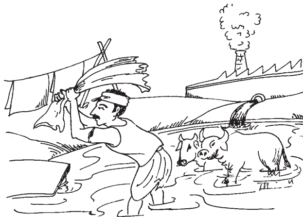
चित्र 16.2 जल प्रदूषण

7. जल प्रदूषण- वह जल जिसमें अनेक प्रकार के खनिज कार्बनिक-अकार्बनिक पदार्थ, गैसों तथा कई अनावश्यक एवं हानिकारक पदार्थ अधिक मात्रा में घुल जाते हैं, प्रदूषित जल कहलाता है।