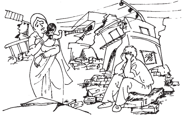
चित्र 16.4 भूकम्प

1. भूकंप- भूकंप की उत्पत्ति पृथ्वी के आंतरिक भाग में असंतुलन से होती है। पृथ्वी के आंतरिक भाग की तापीय दशाओं में परिवर्तन से भूपृष्ठ के अकस्मात कंपन को भूकंप कहते हैं। भूकंप से उत्पन्न तरंगों का घातक प्रभाव हजारों वर्ग किलोमीटर तक होता है।