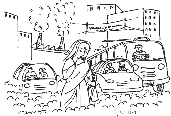
चित्र 16.1 वायु प्रदूषण के प्रभाव

6.1 वायु प्रदूषण- जब वायुमण्डल में बाह्य स्रोतों से धूल, गैस, दुर्गन्ध, धुआँ और वाष्प इतनी मात्रा में उपस्थित हो जाए कि उससे वायु के मूल गुणों में अंतर आ जाए तथा उससे मानव जीवन और संपत्ति को नुकसान होने लगे तो उसे वायु प्रदूषण कहते हैं।