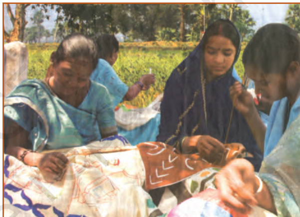
Creativity in needle work

Creativity is usually associated with 'newness' and 'originality'. There is, however, another aspect to it that is equally important — 'appropriateness'. The creative work, besides being new and original, should also be appropriate to its context. To achieve this, a familiarity with the chosen form is needed. For example, the artist paints new and original paintings with complete awareness of her/his art. Just as she/he needs to know her/his materials and medium, so does a writer. A natural flair for creative expression needs to be enhanced by 'training' and 'nurturing'.