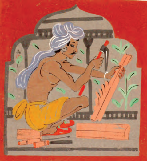
The Carpenter, a painting by Nand Lal Bose