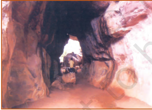
भीमबेटका की गुफा के चित्र