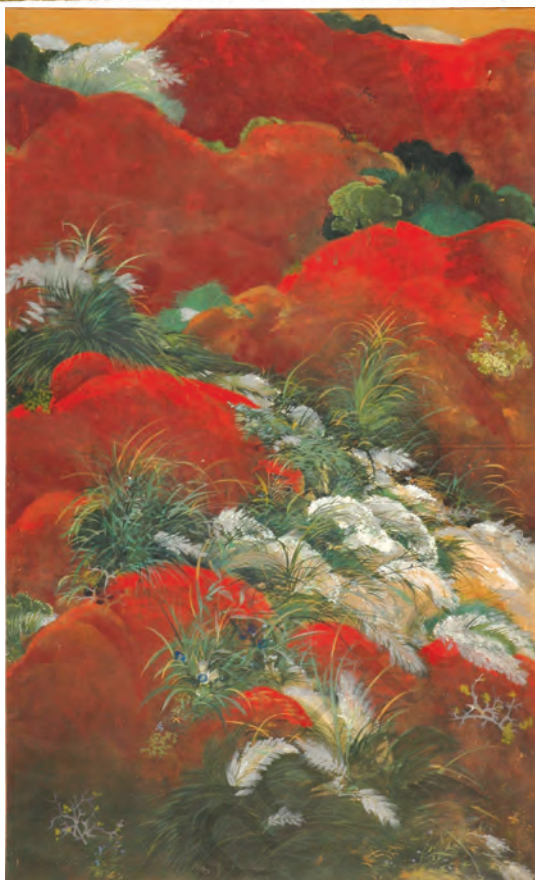
Laughter, a painting by Benode Behari Mukherjee