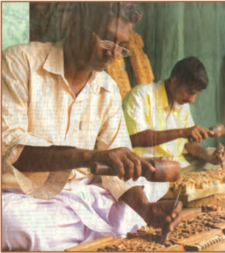
Sculptors at work

Let us take the example of a potter. A lump of clay takes a beautiful shape in her/his hands. Similarly, a stone takes the shape of a mesmerising sculpture in the hands of a sculptor.