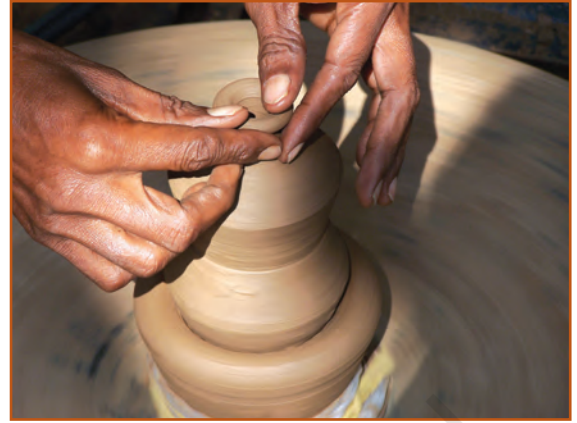
मिट्टी को आकार देते हाथ

के घर, पहनने के कपड़े – सब में मनुष्य ने सुंदरता की रचना की। जब हम माँ को रोटी पकाते देखते हैं तो लगता है 'दुनिया की सबसे आश्चर्यजनक चीज़' बन रही है। रोटी का गोल-गोल बनना और तवे पर फूलना – यही तो सृजन है। सोचने पर लगता है कि इस एक गोल, पकी हुई, भाप भरी रोटी के पीछे कितना श्रम, समय और मन लगा होगा। गेहूँ की बुवाई से लेकर रोटी के फूलने तक – सृजनात्मकता की सबसे बड़ी गाथा है।