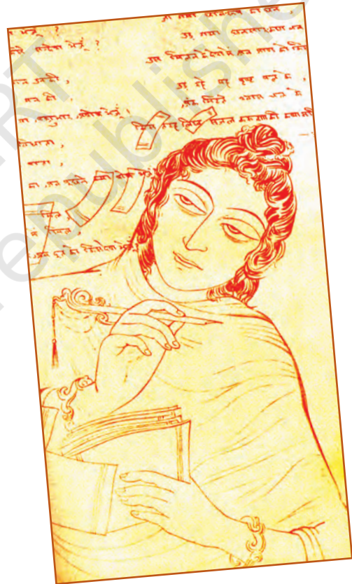
महादेवी वर्मा का एक रेखांकन

इसी तरह मिट्टी का एक लोंदा आकार लेता है। देखते ही देखते गीली मिट्टी का एक गोला घूमते चाक पर कारीगर की हथेलियों के बीच सँवरते-सँभलते सुघड़ सुराही में बदल जाता है। कभी-कभी यह देखकर आश्चर्य होता है कि मनुष्य का हाथ कैसे मिट्टी को सुडौल आकार दे देता है। इसी तरह मूर्ति भी बनती है। शुरू में कुछ भी नहीं होता। बस पुआल, बाँस की खपच्चियाँ और मिट्टी। देखते ही देखते मनुष्य की देह जितनी बड़ी आकृति बन जाती है। पत्थर को तराशकर, पहाड़ को काटकर ऐलोरा की महान मूर्तियाँ बनीं। कई बार एक ही रचनाकार अपने आप को कई कला रूपों में अभिव्यक्त करता है। रवींद्रनाथ ठाकुर, महादेवी वर्मा, शमशेर आदि ऐसे ही रचनाकार हैं।