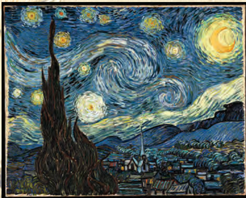
Starry Nights, a painting by Van Gogh

Twinkle, twinkle, little star, How I wonder what you are! Up above the world so high, Like a diamond in the sky!